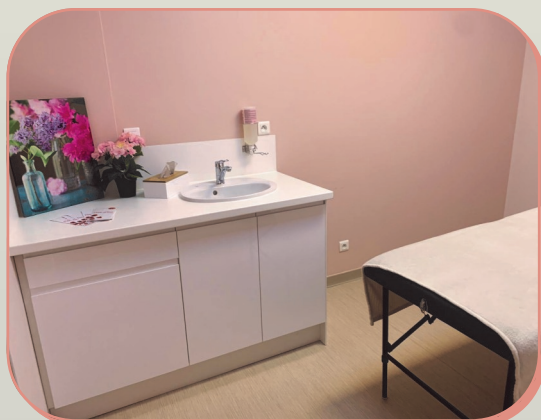
En Oncologie à l'hôpital d'Angoulême