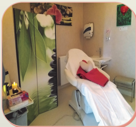
à l'Hôpital de Cognac