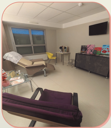
Au Centre Clinical